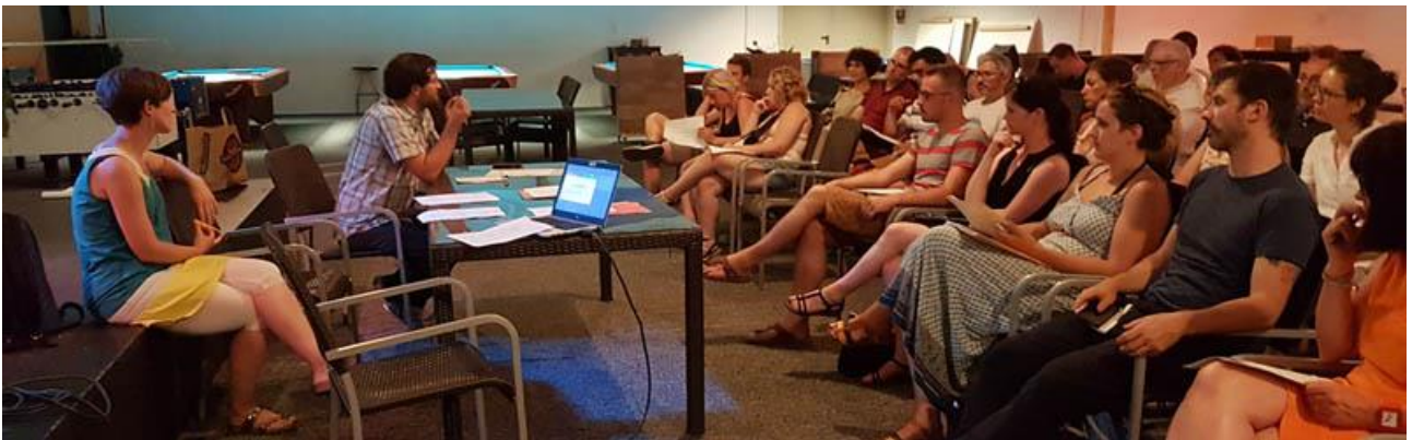
Conférence de presse à l'occasion du lancement du projet Jura Jeunes 4.0