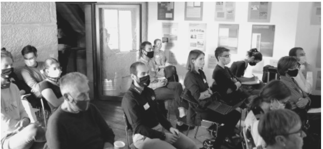
Rencontre annuelle EasyVote au Polit-Forum à Berne le 23 septembre 2020.

Plusieurs contacts permettant de se tenir au courant des multiples offres de la fédération ont été agendés durant cette année. Que ce soit par les brochures EasyVote ou par l'aide à la création de parlements de jeunes, la collaboration avec la Fédération suisse pour les parlements de jeunes offre des prestations susceptibles d'intéresser les communes ou le projet de cyber-parlement. La déléguée a également assisté à la Conférence EasyVote "De la rue à l'urne" du 23 septembre au Polit-Forum à Berne. Le sujet qui y était abordé était celui de la participation et de l'engagement politique des jeunes à l'heure des grèves du climat.