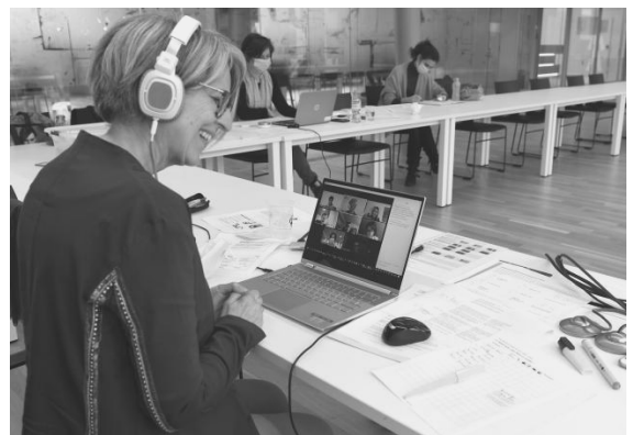
La journée cantonale Jura Jeunes 4.0 s'est déroulée de manière virtuelle.

Le projet Jura Jeunes 4.0 est également piloté par la Commission de coordination en charge de la stratégie politique de la jeunesse. Une première étape qui visait la récolte de données, leur analyse (collaboration avec HES-SO, HETSL, HEG-ARC) ainsi que les résultats en découlant (consultables sur www.oxyjeunes.ch ) a permis de connaître, entre autre, les besoins des jeunes jurassiens.