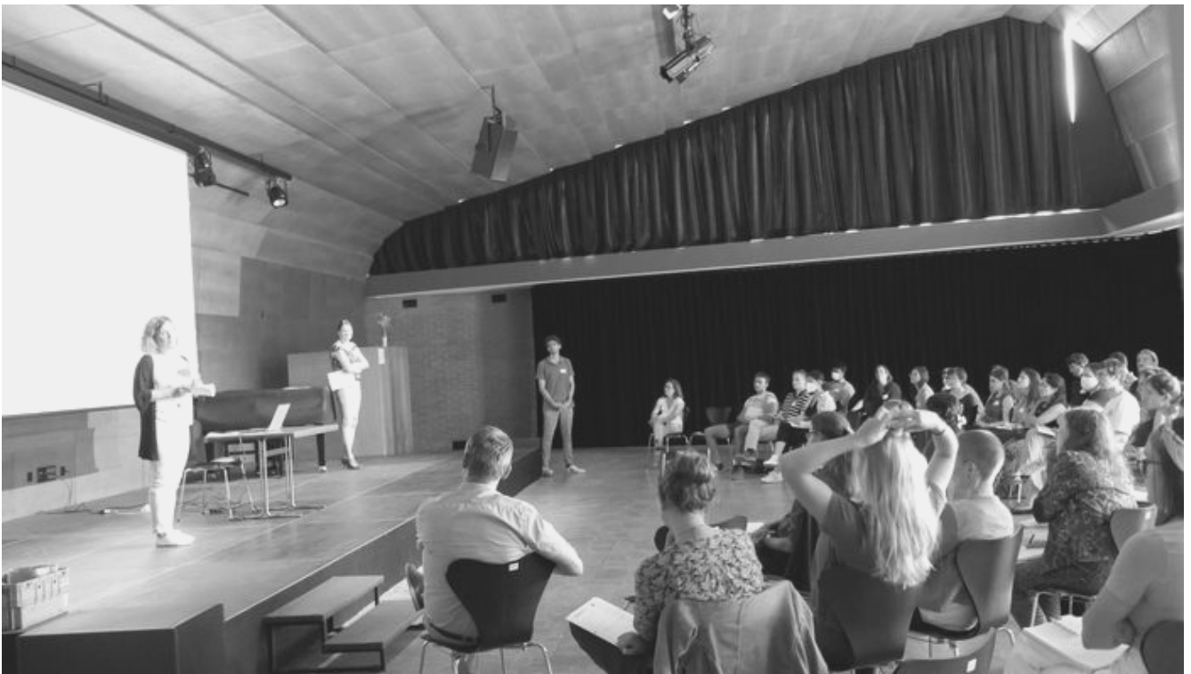
Rencontre annuelle "Jeunesse en action" à la Maison Farel à Bienne, le 27 août 2020.

Les deux organismes, Infoclic et Movetia, se sont approchés de la déléguée à la jeunesse en vue de maintenir ou créer de nouvelles synergies pour la jeunesse et notamment concernant les offres de mobilité ou de participation pour les jeunes. Au printemps 2020, la déléguée à la jeunesse aurait dû suivre un module de formation "Movetia" pour le lobby du travail social en faveur des jeunes. Hélas, la crise sanitaire n'aura permis que des discussions informelles malgré tout très enrichissantes. En août, Movetia organisait la rencontre annuelle du programme "Jeunesse en action". La déléguée s'y est rendue et a pu participer à un atelier sur le thème de l'évaluation des activités de jeunesse. Elle a également pu renforcer son réseau en rencontrant plusieurs acteur.rice.s du domaine de la jeunesse en Suisse.